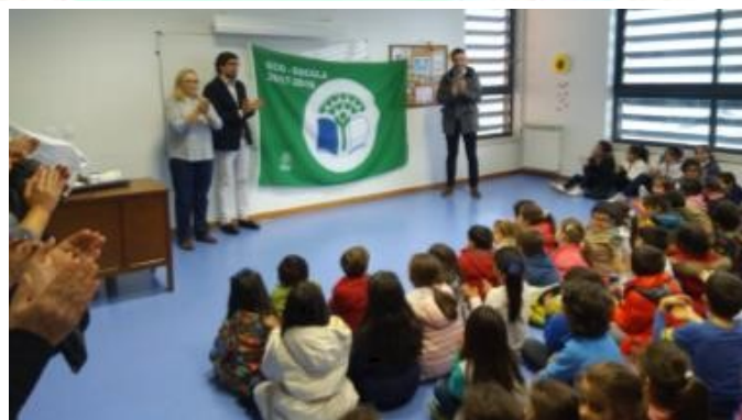
Centro Escolar de St. André 2018-11-20