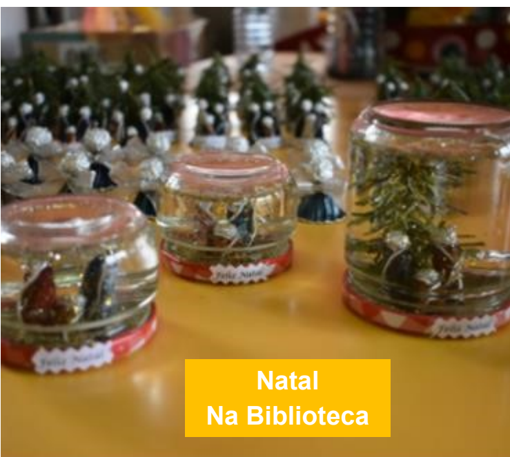
Natal Na Biblioteca