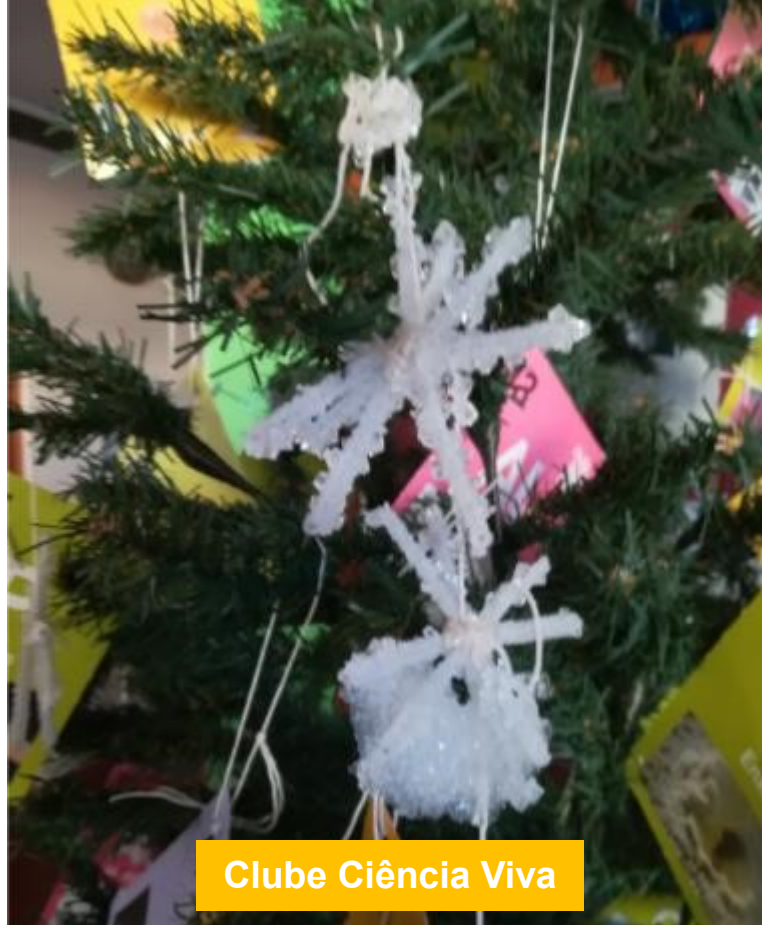
Clube Ciência Viva