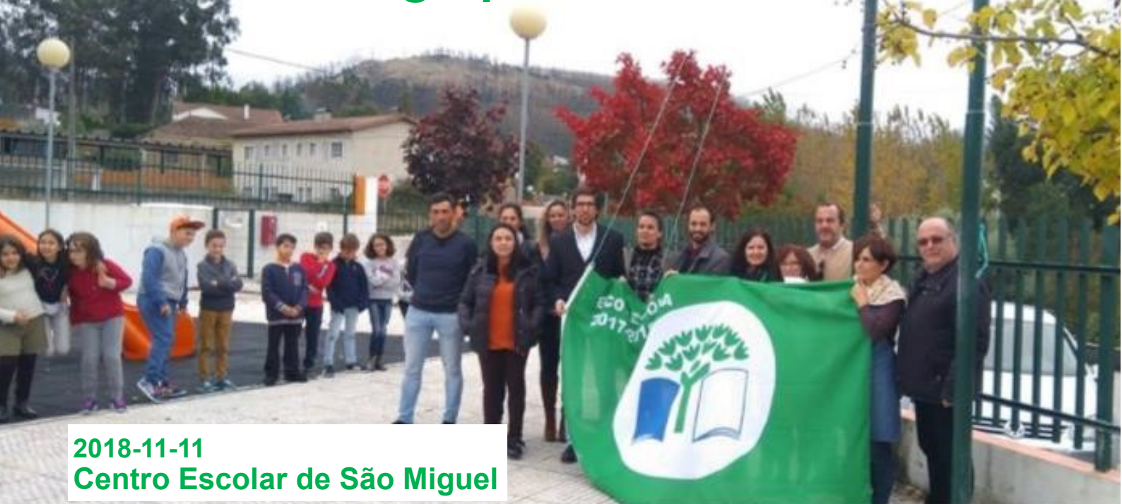
2018-11-11 Centro Escolar de São Miguel