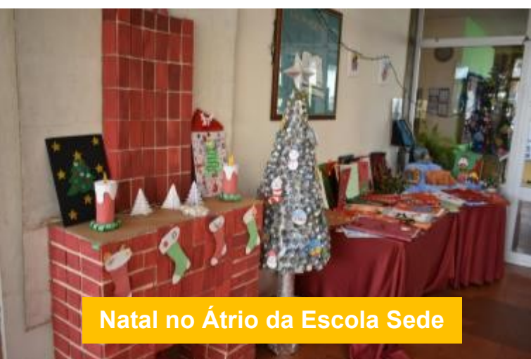
Natal no Átrio da Escola Sede