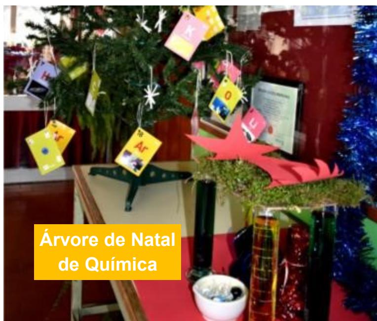
Árvore de Natal de Química