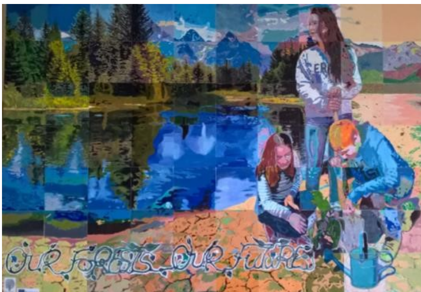
Mural Our Forest Our Future 2013/17

No átrio da escola sede Elaborado por alunos dos seis países do programa ERASMUS+